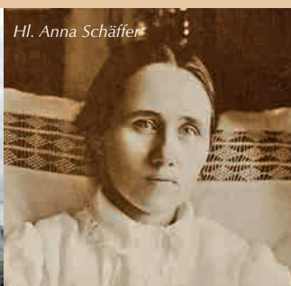
Hl. Anna Schäffer